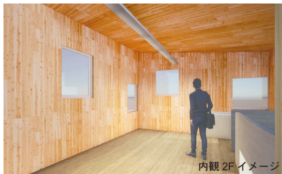
内観 2F イメージ