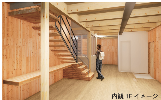
内観 1F イメージ

建築主: 株式会社江真コンサルティング 意匠設計: 株式会社 ofa 構造設計: 株式会社 構造計画プラス・ワン 設備設計: 株式会社アイ設計 施工: 吉富工務店株式会社 CLT 製作・加工: 銘建工業株式会社